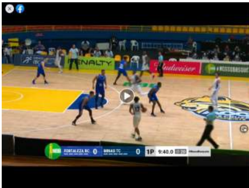
NBB TEMPORADA 2020/2021