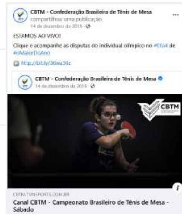
CBI TÊNIS DE MESA 2019