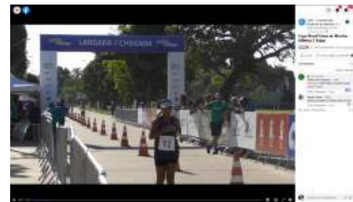
CBI ATLETISMO MARCHA ATLÉTICA 2020