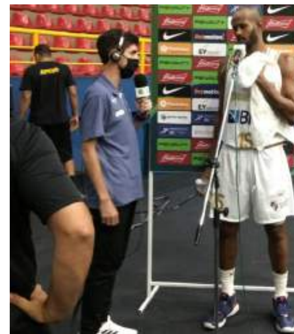
AÇÃO COM IMPRENSA